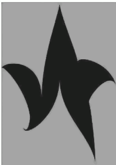
Рис. 1. Это произведение направлено на возбуждение религиозной вражды