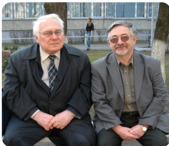
Два профессора – Е.Ф. Тарасов и И.А. Стернин

Научные интересы Иосифа Абрамовича поистине безграничны: лексикология и семасиология, когнитивная и контрастивная лингвистика, речевое воздействие и риторика, психолингвистика и лингвокриминалистика. Каждое направление получило мощный научный заряд от Иосифа Абрамовича Стернина: монографии, учебные пособия, сборники статей... Так много научных идей, которые требуют еще нашего осмысления!