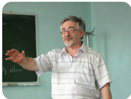
Выступление на конференции