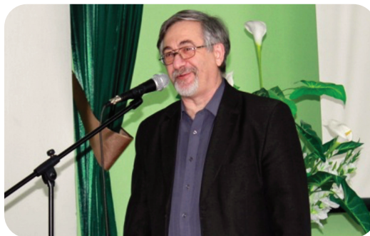
Публичное выступление на Дне грамотности. Областная библиотека им. Никитина, Воронеж