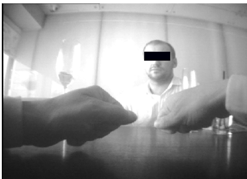
Рис. 4. Экспонирование жеста «Счет / Отсчет денег» – фаза 3 Fig. 4. Gesture “Counting money” display. Phase 3

Итак, во-первых, на выплату наличных указывает иконическая (образная) составляющая жеста, которая по существу является имитацией счета или отсчета банкнот. Во-вторых, на адресата жеста – получателя денежной суммы – указывает его направленность: жест пространственно направлен в сторону Коллектора. Виртуальные деньги отсчитываются в его сторону, причем провокатор взят-