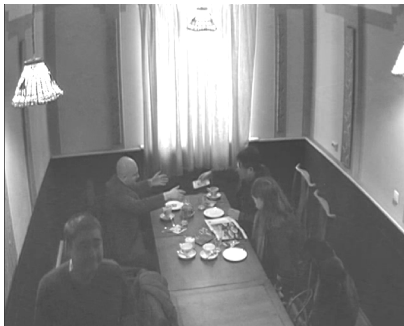
Рис. 1. Момент передачи денег на видеозаписи оперативно-разыскного мероприятия Fig. 1. The situation of money handing over recorded while intelligence gathering

В проведенной официальной лингвистической экспертизе сделан следующий вывод: в разговоре не обсуждается передача денежных средств, хотя «картинка» недвусмысленно указывает на то, что коммерсант передает банкноты оперативнику. Вывод лингвистической экспертизы правомерен, но неполон. Действительно, хотя вербальное подтверждение передачи денег отсутствует, но невербальная часть коммуникации – видеоряд – содержит всю необходимую информацию. В этом случае требуется проанализировать объект исследования в терминах семиотики, рассмотрев видеоролик в динамике как разворачивающийся сюжет повествования: посещение ресторана, деловые переговоры и т. п. В ранее опубликованной статье автора [Баранов, 2018] для этого предлагается использовать категориальный аппарат (метаязык), основанный на грамматиках сюжетов (story grammars) (подробнее о них см.: [Arijon, 1991; Prince, 1973; Rumelhart, 1975]). Анализ сюжета динамического повествования проводится по следующим основным составляющим: экспозиция, событие, эпизод, сцена, резюме (завершение).