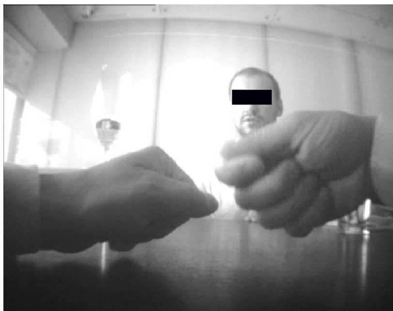
Рис. 2. Экспонирование жеста «Счет / Отсчет денег» – фаза 1

В рассматриваемом случае аргументы относятся как к семантике, так и к прагматике диалога. Кроме того, необходимо учесть семантику и прагматику жеста как части семиозиса диалога, включающего вербальные и невербальные знаки.