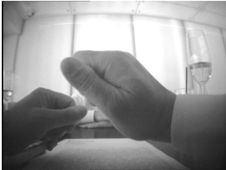
Рис. 7. Экспонирование жеста «Счет / Отсчет денег» – начальная фаза Fig. 7. Display of gesture “Counting money” – the initial phase

Семантика фразы тратит, одевается, долги отдала предполагает, что оплата каких-то услуг или возврат долгов произведены наличными.