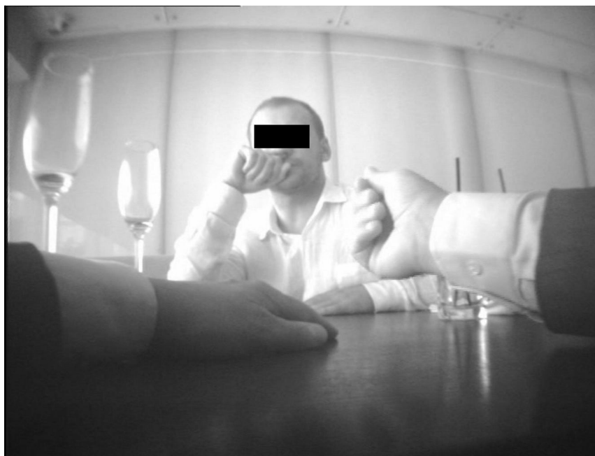
Рис. 6. Экспонирование жеста «Тити-мити»

(6) Коммерсант: Нет, такая хорошая. Была вообще свинья свиной, худая, злая какая-то как собака. А сейчас видимо бабкок заработала такая, тратит, одевается, долги отдала.